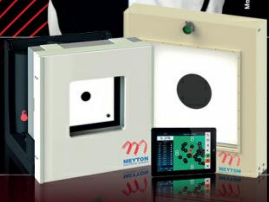
Darstellung nicht maßstabgetreu

MEYTON ANLAGEN STEHEN FÜR HOCHWERTIGE, IN DER INDUSTRIE UND IM PROFISPORT BEWÄHRTE , 100% BERÜHRUNGSLOSE INFRAROT-MESSTECHNIK. UNSCHLAGBAR IN ALLEN DISZIPLINEN VON 10M BIS 100M.